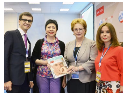
Презентация журнала «Здравоохранение России» коллективом ИД «ЕвроМедиа» министру здравоохранения РФ В.И. Скворцовой в рамках проведения Петербургского международного экономического форума в 2015 году.