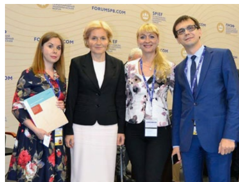
Вице-премьер России Ольга Голодец с сотрудниками издательского дома «ЕвроМедиа»

С 2016 года журнал «Здравоохранение России» приобрел федеральный статус. Освещается система здравоохранения Российской Федерации.